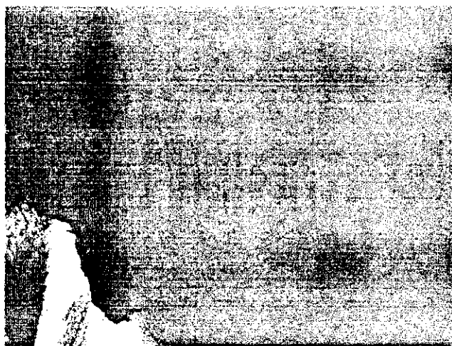
Фигура 5. Изменения по вимето при говедо, болно от заразен нодуларен дерматит