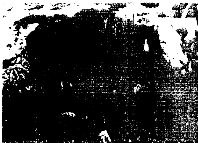
Фигура 2. Възловидни изменения по кожата на цялото тяло при говедо, болно от заразен нодуларен дерматит