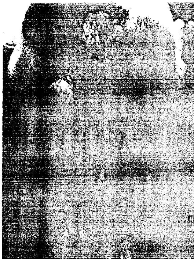
Фигура 4. Възловидни образувания по вулвата, перинеума и вимето при говедо, болно от заразен нодуларен дерматит

Българска агенция по безопасност на храните, гр. София, 1606, бул. "Петко Славейков" № 15А