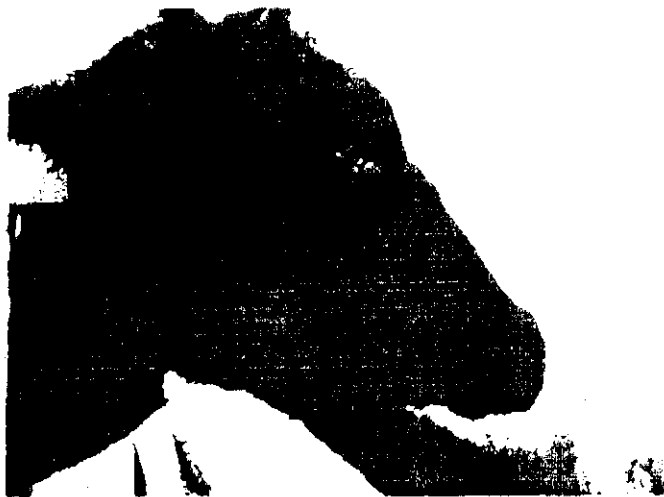
Фигура 1. Слизести изтечения от очите при говедо, болно от заразен нодуларен дерматит